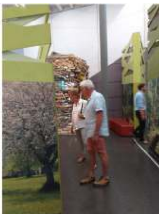
Haus der Flusse