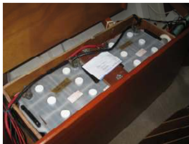
2 lichtaccu's, met een briefje erbij wanneer het accuwatervolume gecontroleerd is. (Zeiljacht "Happy Hours")

Dit geldt alleen voor natte accu's. Bij scheepstagrijnen hebben ze van die handige vulkannen waarmee je automatisch het vloeistofniveau op peil brengt. Gebruik alleen gedemineraliseerd water, geen drinkwater! Om de paar maanden is OK.