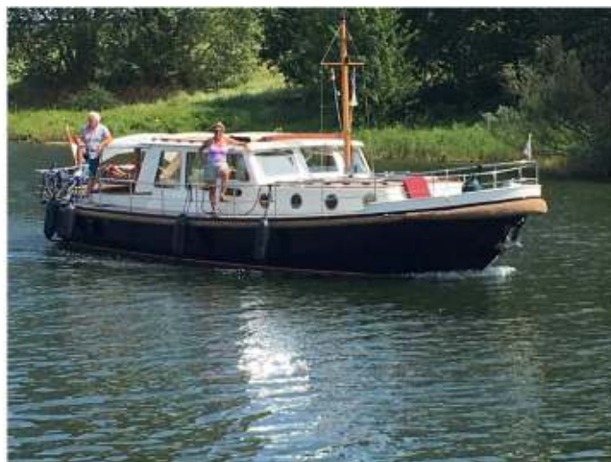
Weer in de thuishaven