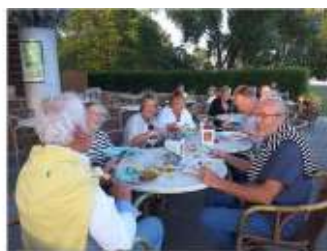
Weerzien in Wolfsburg

liggen in de haven van Wolfsburg als wij binnen komen varen. Een gezellig weerzien dat gevierd wordt op een terras van het mooi aangelegde park aan de Allersee(tje), net achter de haven.