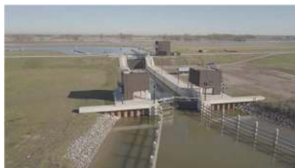
Boven: de Scheeresluis.