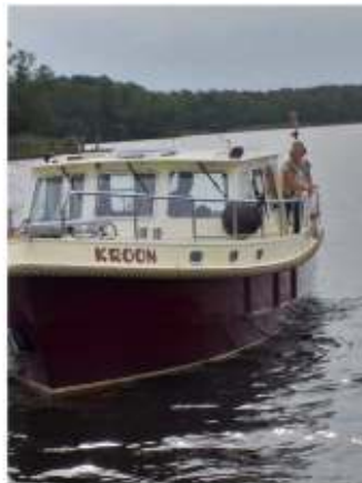
Ontmoeting met Kroon

Na een tocht over de Krimenicksee en de Kruppelsee varen we diep het Spreewald in naar Markisch Buchholz. Daar loopt voor ons de doorvaart dood. Vandaaruit is de mogelijkheid via een sleeptunnel met een kano verder het Spreewald in te trekken. Op vaart hiernaartoe spotten we visotters en bevers! En de prachtige natuur. We leggen aan op een Wasserwanderplatz. Een prachtig wandel- en kanogebied. Maar wij besluiten de volgende dag dit gebied weer te verlaten Na de 2 sluizen, met zeer gemoedelijke bediening en een snoepje van de sluiswachter varen we op Woensdag 29 mei naar de bestemming Bad Saarow. Wat mij betreft de mooiste plek van onze reis.