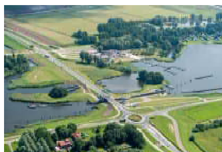
Links: de Roggebotsluis