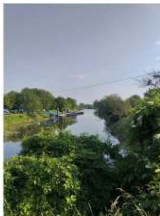
Frankfurt a/d Oder

Nog ± 25 kilometer varen we deze dag op deze grensrivier tussen Duitsland en Polen. Een spannend tochtje. De gele + en x bakens op de wal waar je op moet varen zijn op dit traject soms moeilijk waar te nemen, maar wel van groot belang om de meanderende vaargeul te benutten en ondieptes te vermijden. De dieptemeter schiet van ruim een meter naar 20 centimeter en lager. We varen door tot Frankfurt a/d Oder. Een redelijke haven, maar op dat moment weinig passanten, wij vermoeden wel wat de reden is! Wel heel veel campers op het terrein en rondom de haven. Maar deze hebben geen last van de snel wisselende waterstanden. Het gebied is prachtig!