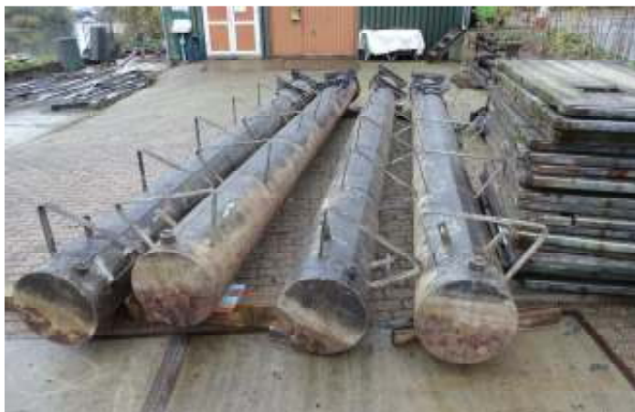
Materiaal voor een nieuw oppivlot. Zie het artikel "Bericht van de DWW'ers" in dit nummer.

Bij de voorplaat: De Sirtaki wordt gedanst tijdens "Sluiting Vaarseizoen in Griekse stijl" op 19 oktober.